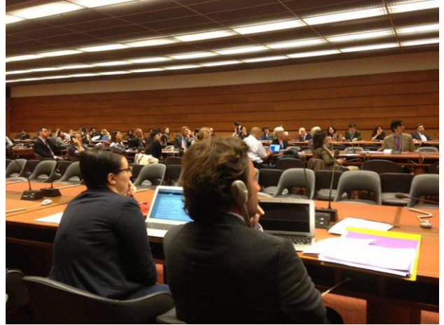
瑞士日內瓦 聯合國人權理事會議